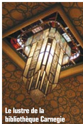
Le lustre de la bibliothèque Carnegie

L'Atelier Simon Marq a réalisé des vitraux dans les lieux les plus prestigieux de la planète : université de Jérusalem, bâtiment des Nations Unies à New York, Art Institute of Chicago, Norris' Hospital de Los Angeles, St-Joseph's Hospital de Stockton (USA) ou encore, plus proche de nous, dans la cathédrale de Metz.