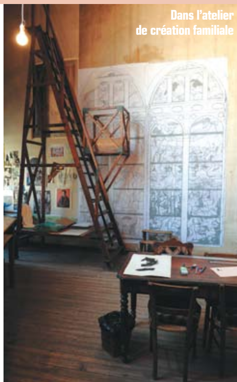
Dans l'atelier de création familiale