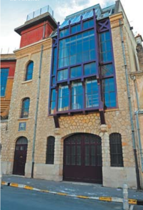
La façade Arts Déco de l'atelier